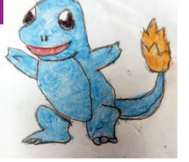
పిల్లలూ, మీ కథలు, బొమ్మలూ పంపండి. ఇదిగో మెయిల్ పిడి: chinnaarips@gmail.com