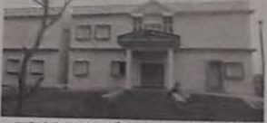
అదర్స్ గృహాలకు రాజకీయ గ్రహణం

అదర్స్ గృహాలకు రాజకీయ గ్రహణం. అదర్స్ గృహాలకు రాజకీయ గ్రహణం. అదర్స్ గృహాలకు రాజకీయ గ్రహణం.