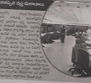
కళాకర్షణ వస్తు దుకాణాలు

వస్త్ర వ్యాపారంపై జిఎన్టీ డెబ్బ వస్త్ర వ్యాపారంపై తీవ్రంగా ప్రభావం చూపుతోంది. వస్త్ర వ్యాపారంపై జిఎన్టీ డెబ్బ వస్త్ర వ్యాపారంపై తీవ్రంగా ప్రభావం చూపుతోంది.