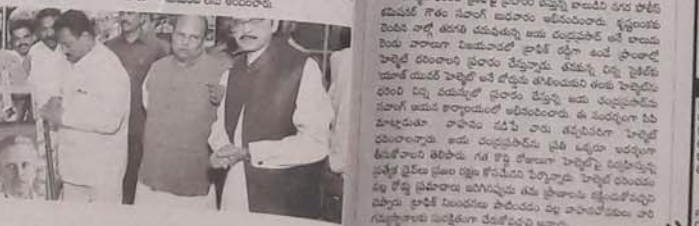
ఫాటో జర్నలిస్టులకు గుర్తింపు హక్కుదీయం

ఫాటో జర్నలిస్టులకు గుర్తింపు హక్కుదీయం. ఫాటో జర్నలిస్టులకు గుర్తింపు హక్కుదీయం. ఫాటో జర్నలిస్టులకు గుర్తింపు హక్కుదీయం.