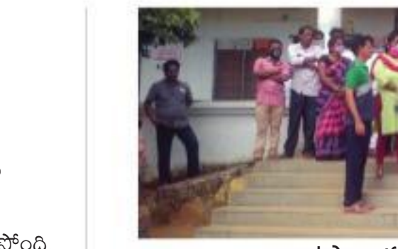
ఉపాధ్యక్షులను వివరాలు అందుకున్న పిఠా

ప్రజాశక్తి ప్రత్యేక ప్రతినిధి - అమరావతి నిధుల మళ్లింపు అధికారులకు తలపోపులు సృష్టిస్తోంది. దీంతో 2020-21 ఆర్థిక సంవత్సరానికి సంబంధించిన సవరణ బడ్జెట్ ను సిద్ధం చేసేందుకు అధికారులు తలలు పట్టుకుంటున్నారు.